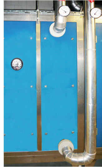
Fläkt-MBL: Neuer Kühler und neue Gehäuseteile, welche den Originalwänden in nichts nachstehen.

Kühlereinfassungen oder Bodenbleche bei Filtern und Mischluftkästen sind ursprünglich oft verzinkt und mittlerweile verrostet. Aus hygienischer Sicht somit nicht mehr tragbar und gefährlich. Ist der Monobloc sonst noch in gutem Zustand, muss nicht gleich das ganze Gerät ersetzt werden. RC Klimatechnik GmbH revidiert seit Jahren Monoblocs und Komponenten, deren Hersteller längst nicht mehr existieren.