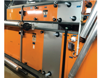
Kühlersersatz durch höhere Kaltwassertemperaturen an einem Hemair-Gerät.